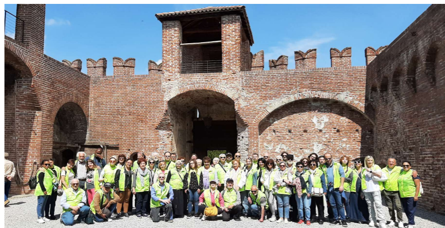
La tradizionale foto di gruppo e, qui sotto, una parziale veduta della tavolata

Oltre alla Rocca, Soncino è famoso anche per la Casa degli Stampatori, ora museo, dove nel 1488 la presenza della comunità ebraica segnò un even-