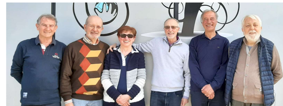
I componenti del direttivo di Amami

Il punto principale è comunque stata l'esposizione dei Bilanci (sia consuntivo che preventivo) al termine della quale si è proceduto per l'approvazione. Il Bilancio consuntivo e il Bilancio pre-