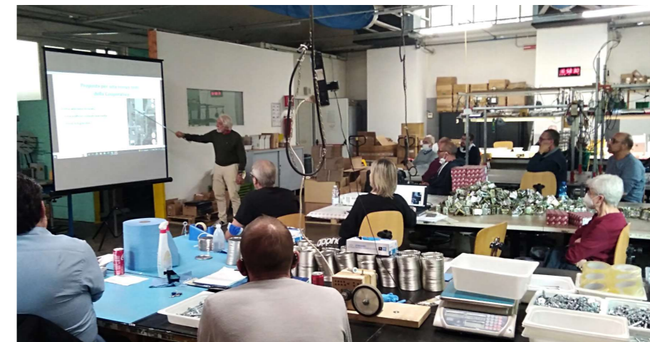
Una parziale veduta dell'assemblea e qui sotto, il progetto della nuova sede

Non ci resta che aspettare nuovi sviluppi legati al finanziamento dell'investimento.