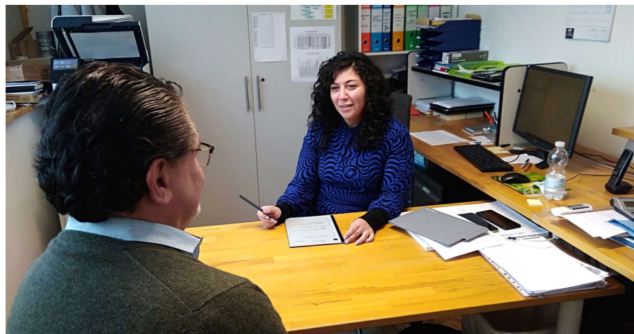
Il nuovo Direttore nonché Educatrice, durante uno dei numerosi colloqui