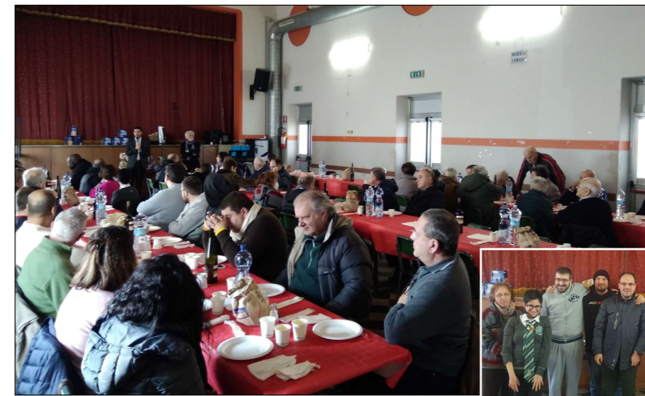
Una bella panoramica della tavolata e nel riquadro, i nostri "dilettanti allo sbaraglio"

Venerdì 23 dicembre scorso, presso il salone dell'Oratorio San Mauro, in un clima più che familiare, si è tenuto il pranzo di Natale della Cooperativa Millemani rivolto a dipendenti, soci, tirocinanti e volontari.